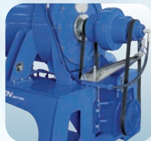
Particolare Rotovariatore e riduttore Detail of Rotovariator and reduction gear